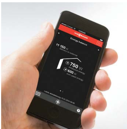
Fernbedien- und -überwachung über Mobiltelefonnetze in Verbindung mit der Vitotrol App für Vitocalor 300-P